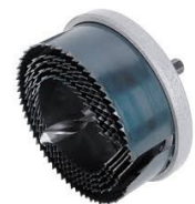
Broca de corona